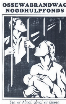
Figuur 2: Amptelike propagandaplakkaat van die OB Noodhulpfonds